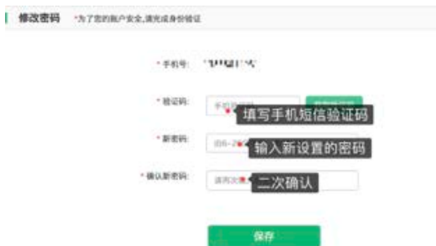
图 8: 修改密码