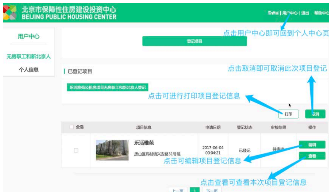
图 20-登记后回到无房职工和新北京人页