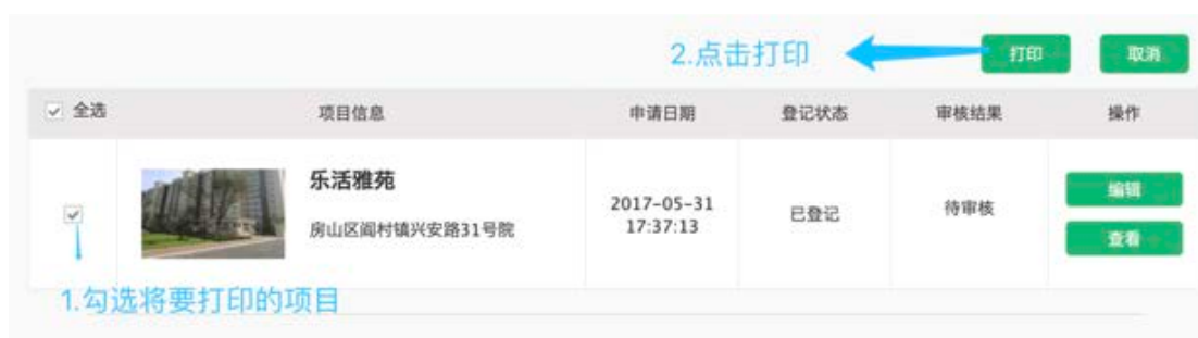
图 21-打印项目的步骤