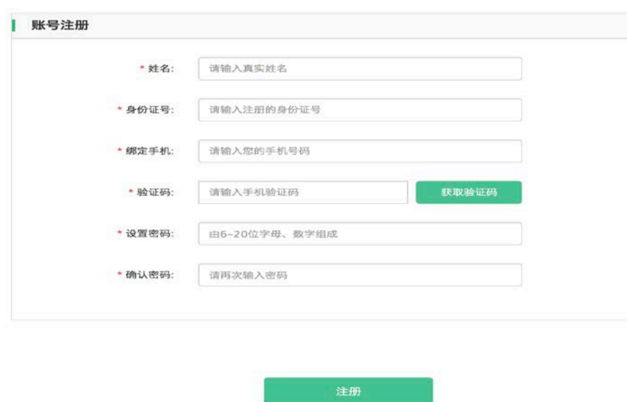
图 6:注册第二步信息填写及密码设置