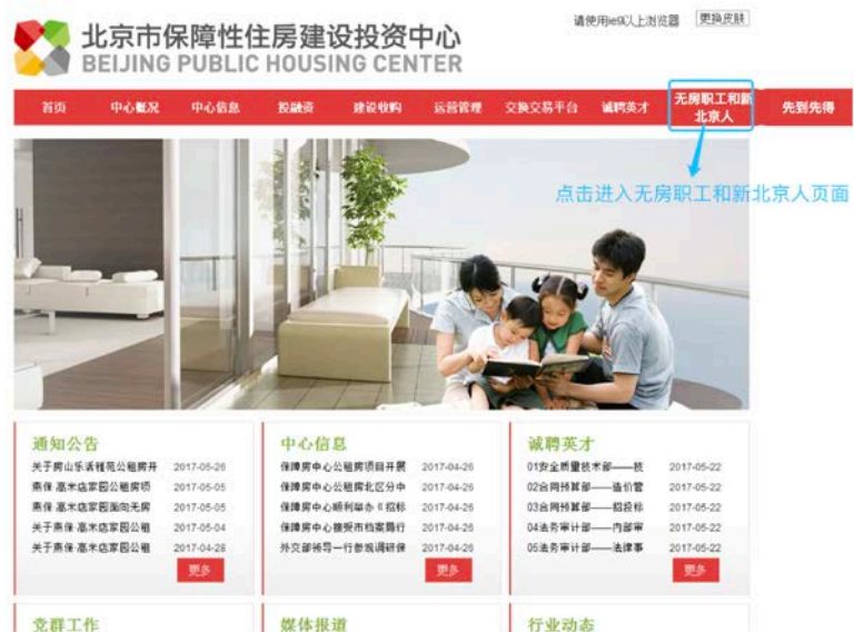
图 1：无房职工和新北京人入口

申请人自行登录北京市保障性住房建设投资中心官网 ( http://www.bphc.com.cn/ )，点击“无房职工和新北京人”按钮进入登记系统界面，按照相应提示进行操作。