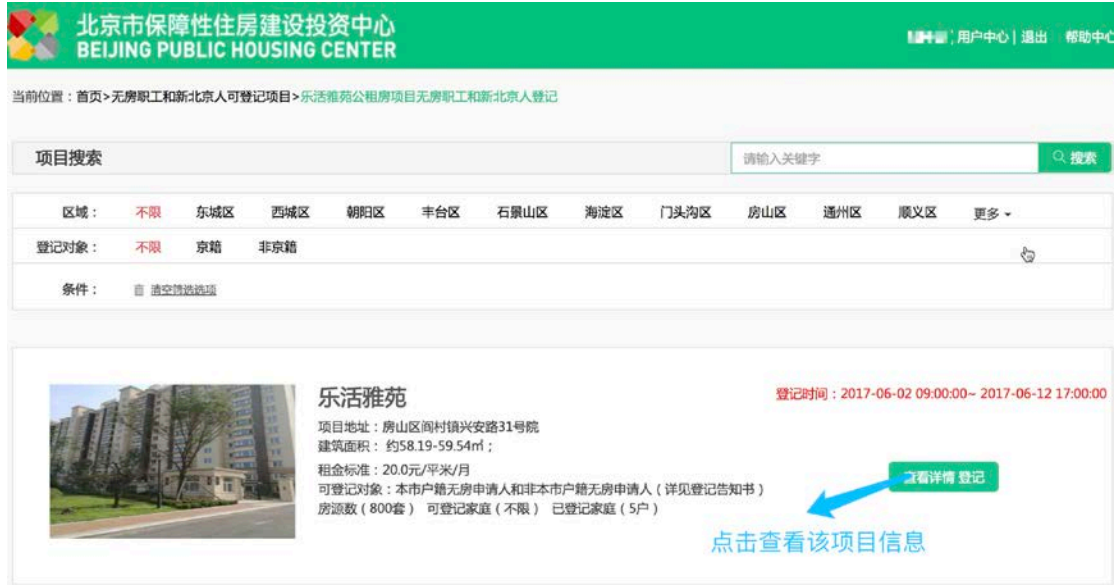
图 11: 可登记项目