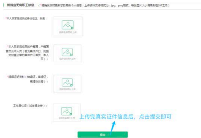
图 16: 上传证件页面