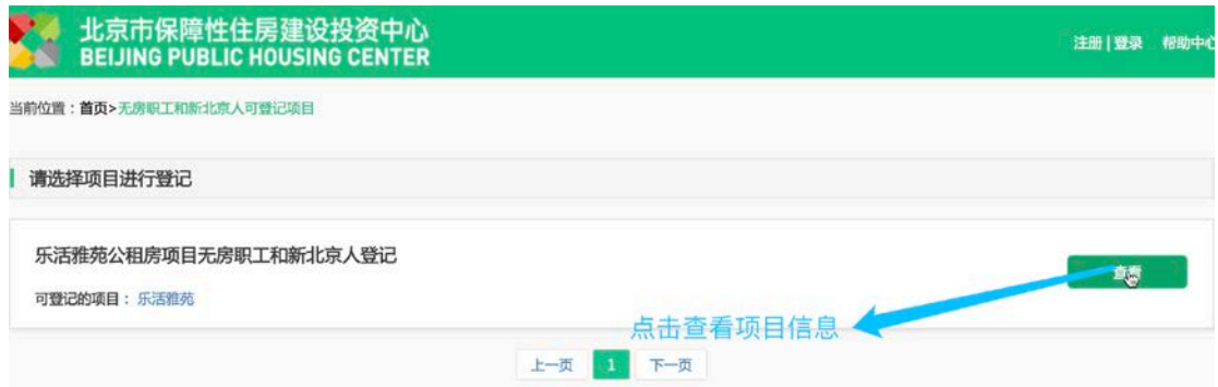
图 2: 无房职工和新北京人页面