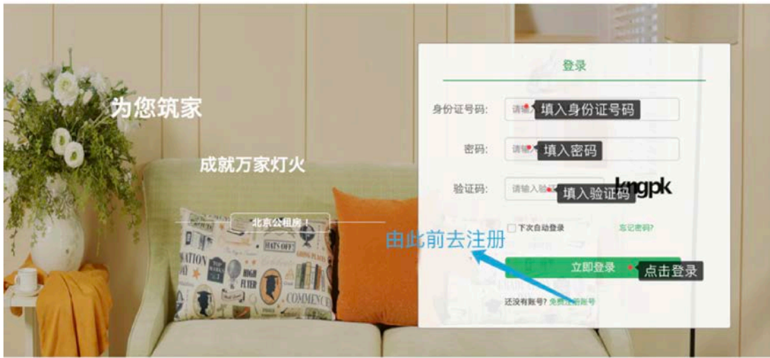
图 4：登录 / 注册页面说明