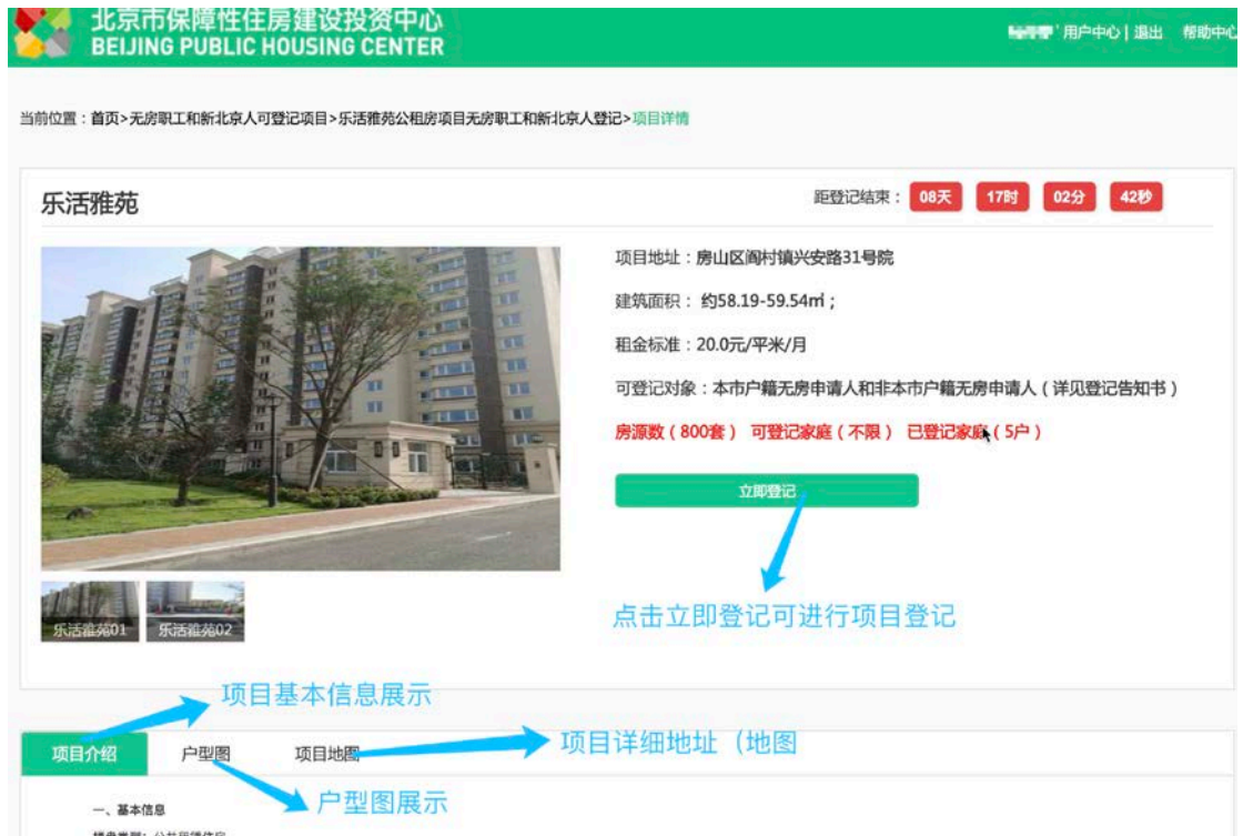
图 12: 项目详情图