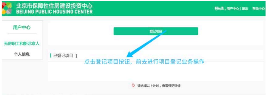
图 9：无房职工和新北京人页面