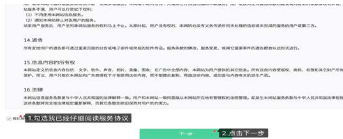
图 5：注册第一步勾选协议

请仔细阅读服务协议，并承诺填写的信息真实有效，然后点击下一步按钮，进行下一步操作。