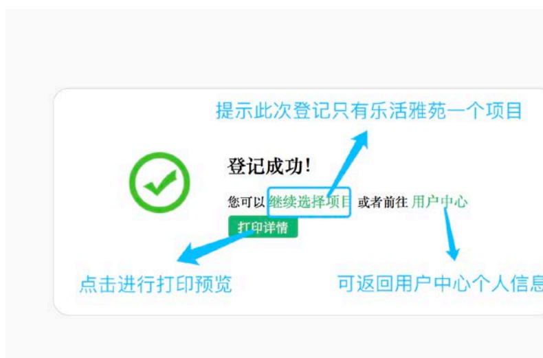
图 17- 登记成功页